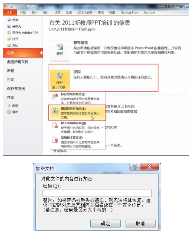
图 4.42 对 PPT 加密的过程

如图 4.42 所示，在 PowerPoint 2010 中打开 PPT 课件，单击“文件”选项卡，先选择“信息—权限—保护演示文稿”，再选择“用密码进行加密”，出现“加密文档”窗口，然后输入密码二次，即可完成 PPT 的加密。